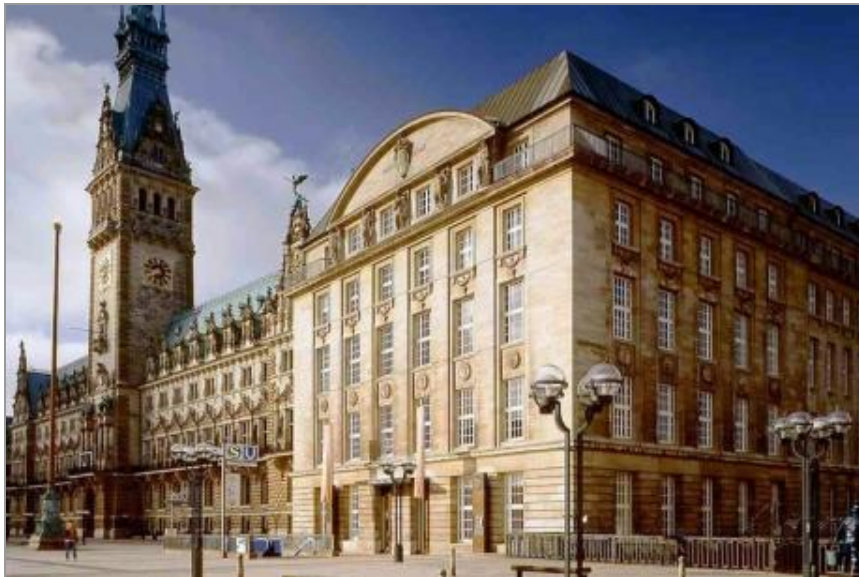
Das Bucerius Kunst Forum neben dem Hamburger Rathaus

Mehr als 80 Werke vieler bekannter Künstler werden im Januar im Hamburger Bucerius Forum für einen guten Zweck versteigert.