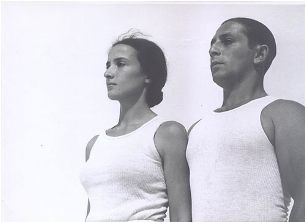
Liselotte Grschebina: Sport in Israel, ca. 1937, Silbergelatineabzug.

100 Fotografien, entstanden in Deutschland und Palästina zwischen 1929 und den sechziger Jahren. 100 Fotografien einer Bildautorin, die in Deutschland noch ganz unbekannt ist. Eine Neuentdeckung, die jetzt im Berliner Martin-Gropius-Bau – erstmals in einer Einzelausstellung – gewürdigt wird.