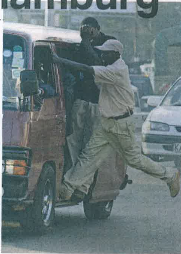
In Kurden gang und gabes Sammeltaxi

Der Senat plant in Zusammenarbeit mit der VW-Tochter Moia den selbstfahrenden öffentlichen Verkehr. Für Kritikerinnen und Kritiker bleiben viele Fragen offen