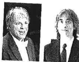
Streiten für Mozart: Thomas Hengelbrock und Kent Nagano