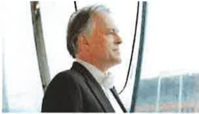
Der Chefdirigent des NDR Sinfonieorchesters Thomas Hengelbrock ist auch Spezialist für historische Aufführungspraxis.

Beschäftigung mit Musik von deren nachhaltiger Wirkungskraft ausgebildet werden. "Musik ist vielleicht das beste Training für jeden Beruf - nicht nur für musische. Für alle Berufe! Es ist das demokratische Prinzip als klingende Philosophie."