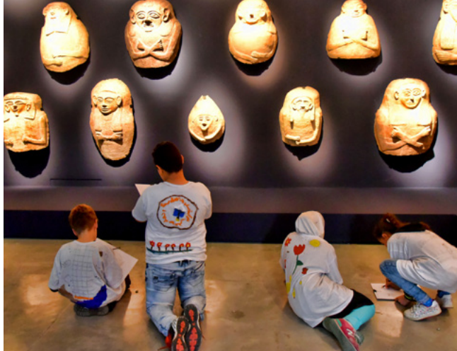
Bridging the Gap Kinder