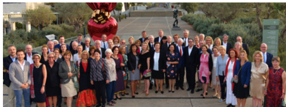
Reisegruppe des Vereins und der Neuen Nationalgalerie vor dem Herz von Jeff Koons