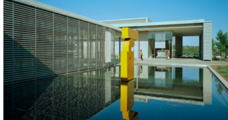
Der Eingang des Museums