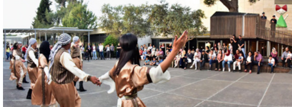
Ramadan Nächte

www.imj.org.il/en und www.imj-germany.de