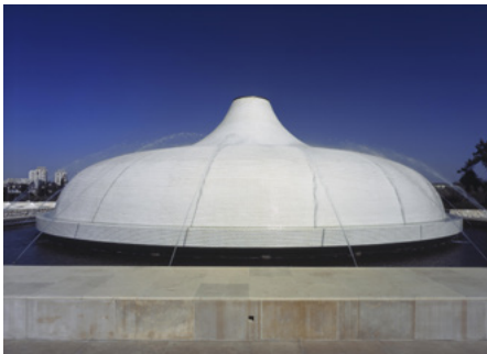
Der Schrein des Buches

Ebenso die prähistorische und archäologische Abteilung sowie Kulturen der Welt mit einer großen Sammlung islamischer Kunst.